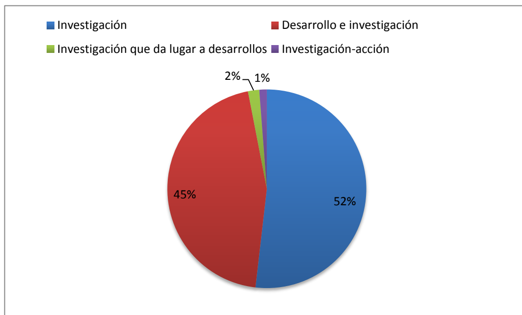
Figura Nº 2. Porcentaje de trabajos de investigación empírica en función de cada subcategoría (N=164).

En la Figura 2 se observa un detalle de la proporción de artículos de investigación según cada una de sus subcategorías. Se destacan dos tipologías principales, los artículos de investigación (52%) y los trabajos que presentan desarrollos didácticos e investigaciones (45%).