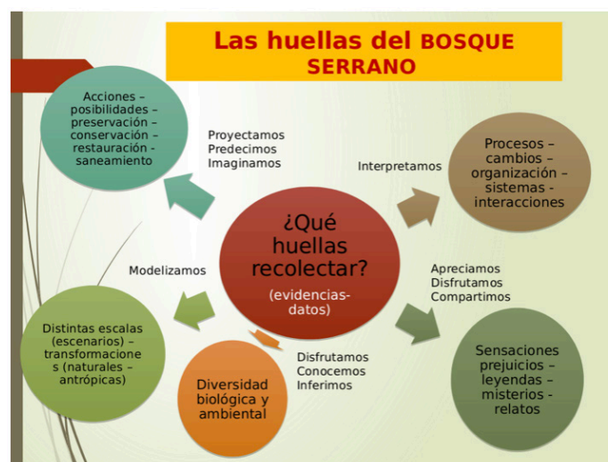
Figura 3: Estrategias de recolección de datos que acompañan cada escenario natural de los senderos y posibilita actividades cognitivas diversificadas