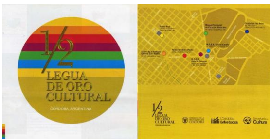
Folletería oficial sobre la Media Legua de Oro.

instituciones totalmente nuevas a partir de la remodelación y refuncionalización de edificios históricos (Paseo del Buen Pastor y MSBA); finalmente, algunas instituciones fueron trasladadas a nuevas y modernas sedes (Ciudad de las Artes y Museo Provincial de Ciencias Naturales, que se emplazó en el ex Foro de la Democracia). Todo este conjunto de obras fue inaugurado con diversas celebraciones entre abril de 2005 y diciembre de 2007. En líneas generales, podemos decir que se trató grandes obras de infraestructura realizadas a partir de una importante inversión económica. Por ejemplo, según datos obtenidos de fuentes periodísticas, en la obra del Museo E. Caraffa se realizó una ampliación de 4400 m a partir el edificio original (de 1200m 22 ), con un costo de, según declaraciones del legislador oficialista Dante Heredia, $16 millones de pesos. xxvi En el caso del Paseo del Buen Pastor, la inversión habría alcanzado los $17 millones de pesos para la construcción de un conjunto edilicio que incluye “6.000 m cubiertos de reciclaje, 3000 m 22 nuevos y un espacio verde”. xxvii