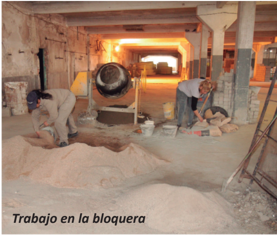
Trabajo en la bloquera