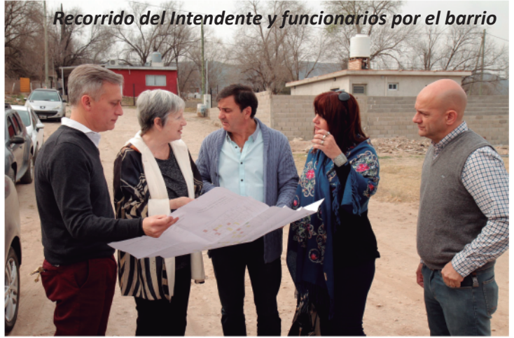
Recorrido del Intendente y funcionarios por el barrio