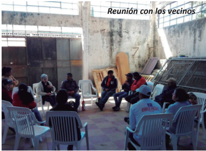
Reunión con los vecinos