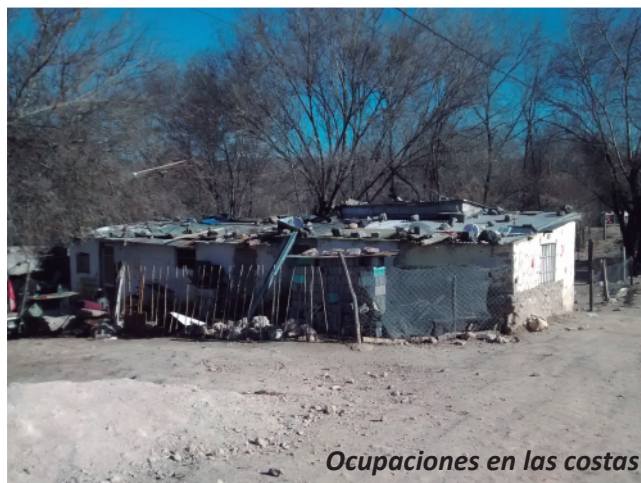
Ocupaciones en las costas

La caracterización del proceso de crecimiento urbano de Villa Carlos Paz no escapa a los rasgos que identifican a todas las ciudades latinoamericanas nacidas en el siglo XX y marcadas por sistemas de apropiación de la tierra signados por la especulación inmobiliaria y la escasa regulación e intervención estatal en la materia .