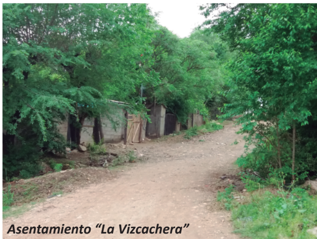
Asentamiento “La Vizcachera”