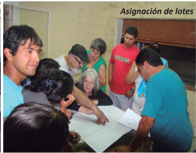
Asignación de lotes

aislamiento social de sus habitantes, con su secuela de marginalidad y violencia.