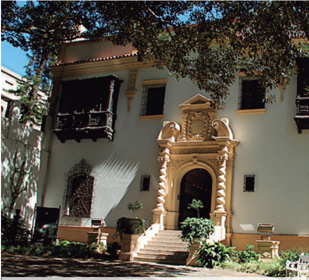
Vivienda Noel Buenos Aires 1920/1922