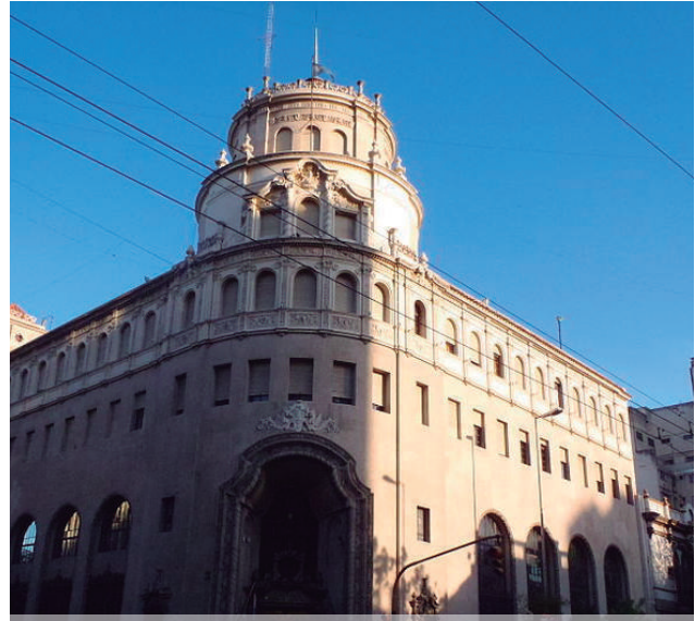
Edificio de la ex Caja de Ahorro de la Provincia