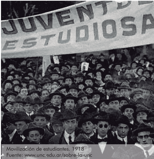
Mobilización de estudiantes. 1918