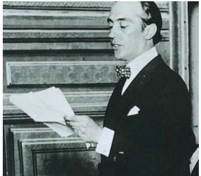
Deodoro Roca en 1918

grantes, a los colonos, a los chacareros y a todos los sectores que hasta entonces eran marginados por la elite gobernante.