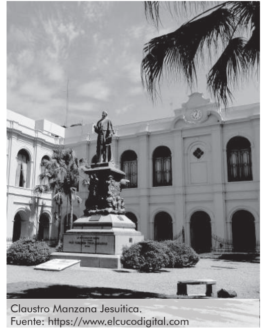
Claustro Manzana Jesuítica.