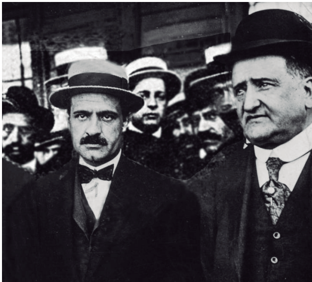
Ortega y Gasset en su visita a Córdoba en 1916