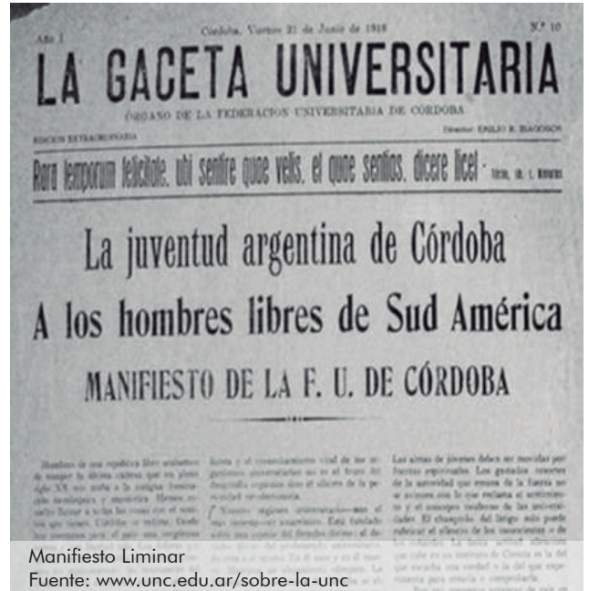
Manifiesto Liminar